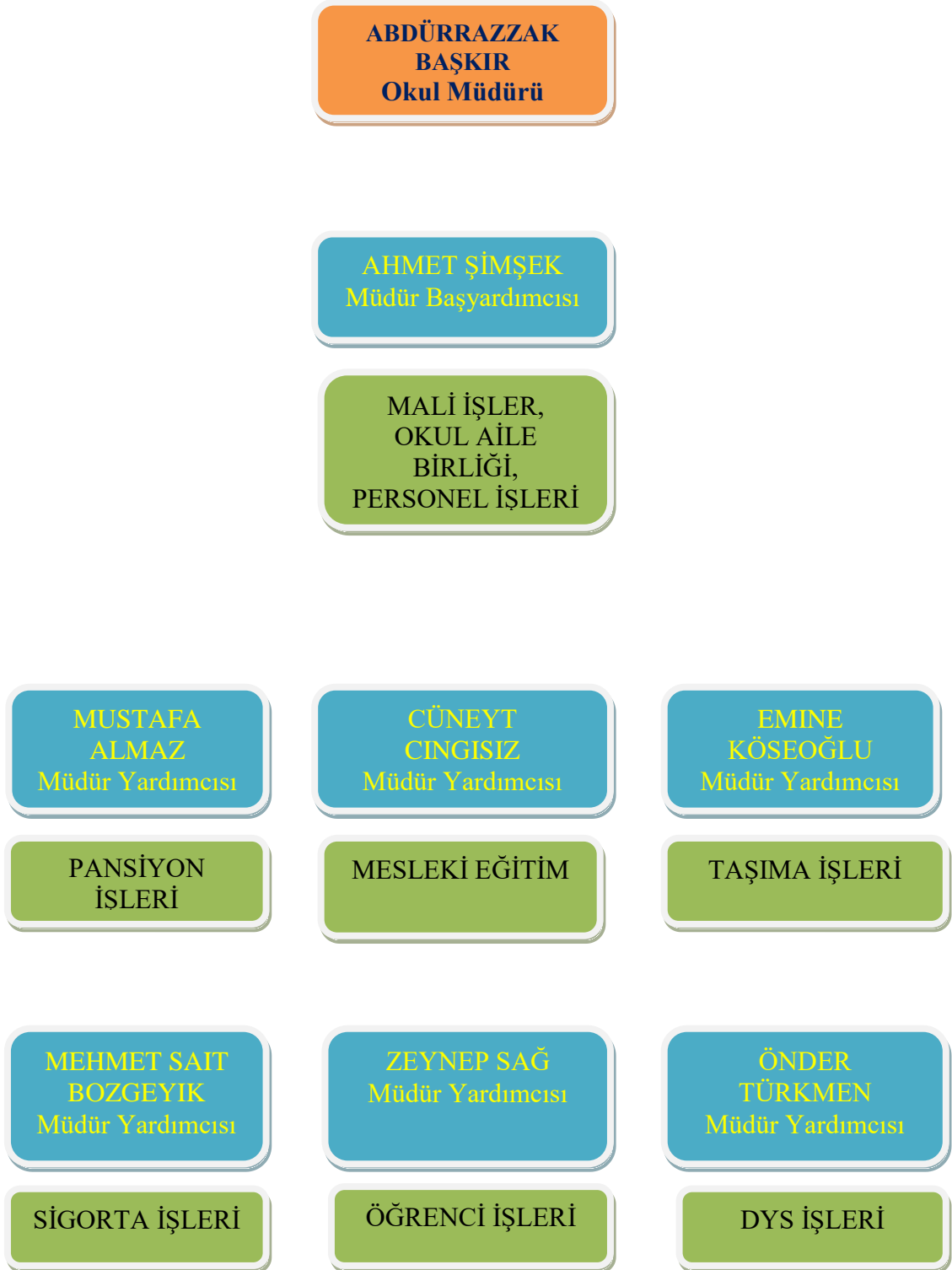
Şekil 4: Oğuzeli Mesleki ve Teknik Anadolu Lisesi Müdürlüğü Organizasyon Şeması